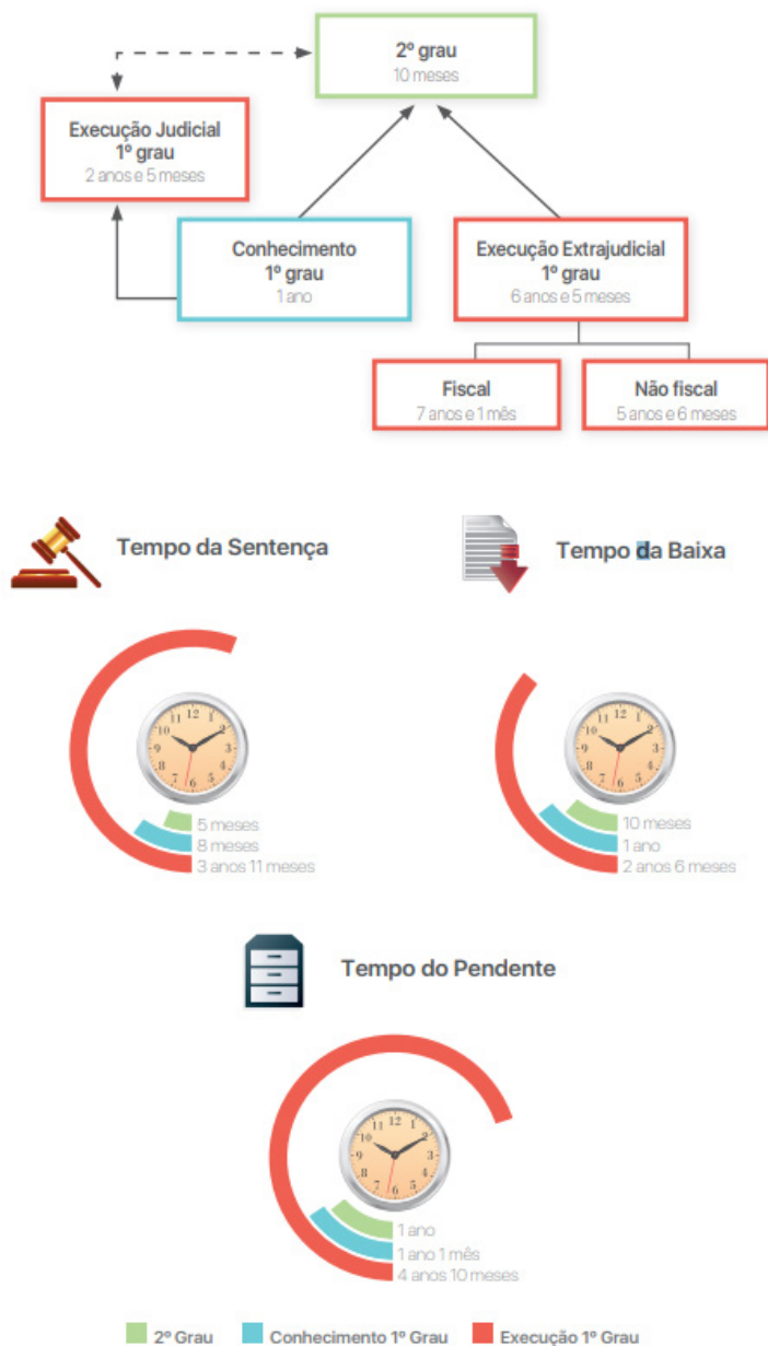
FIGURA 2 - TEMPO MÉDIO DO PROCESSO BAIXADO NA JUSTIÇA DO TRABALHO.